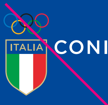
Applicare il Marchio/Logo su fondi di colore non chiari e/o bianchi