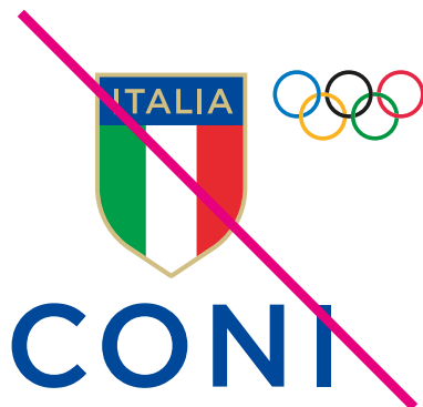
Modificare la composizione o le proporzioni interne del Marchio/Logo

In questa pagina sono illustrati alcuni esempi di errato impiego del Marchio/Logo.