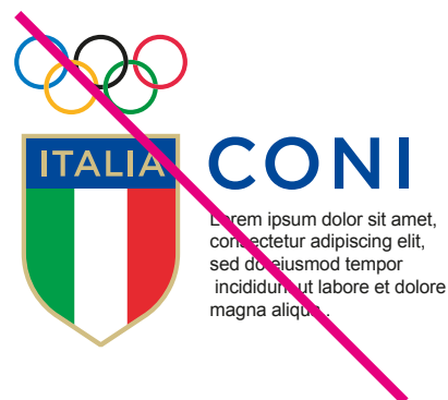
Ignorare l'area di rispetto e le disposizioni per l'allineamento del Marchio/Logo