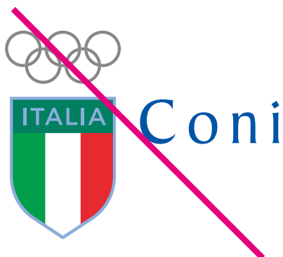
Modificare i caratteri tipografici o i colori istituzionali