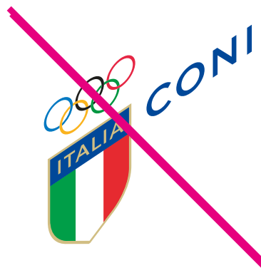
Deformare o distorcere il Marchio/Logo