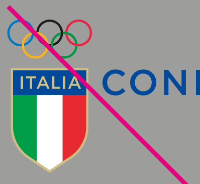
Applicare il Marchio/Logo in modo da diminuirne la leggibilità.